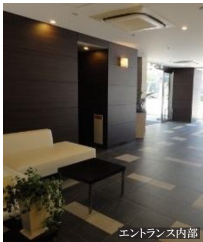
エントランス内部